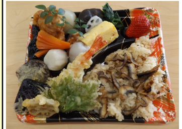
和食あやめのと風弁当