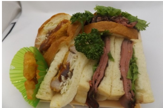
ローストビーフとSPFロースカツのサンドウィッチ