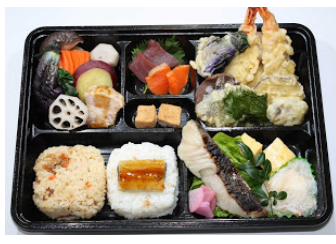
和食あやめの特製和風弁当