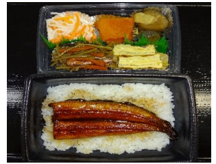
桃太郎うなぎ重二段弁当