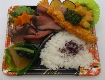
自家製ローストビーフ弁当