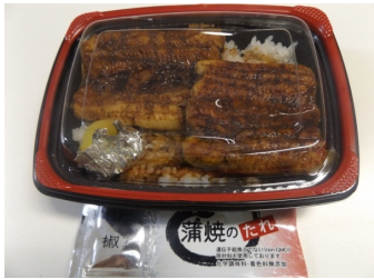
戸村川魚店特製うなぎ弁当