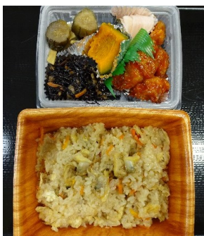
桃太郎あさりご飯二段弁当