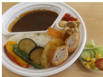
野菜カレー(サラダ付)