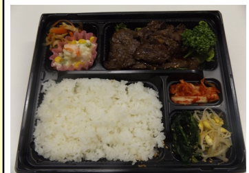
佐原の名店の牛焼肉弁当